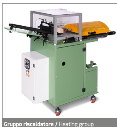
Gruppo riscaldatore / Heating group