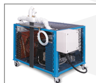
Gruppo refrigerante / Cooling group