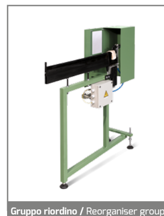
Gruppo riordino / Reorganiser group